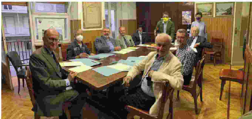
Un'immagine dell'incontro tra la Fondazione Bellezza e la sezione di Biella del Club alpino

Fondazione Bellezza, già a partire dalla primavera 2021, ha investito parte delle sue risorse nell'individuazione, scelta e messa a punto dell'offerta escursionistica e cicloturistica, per poterla promuovere meglio come elemento di forza della proposta turistica. Tutto ciò in stretta collaborazione con gli enti pubblici competenti per lo sviluppo del territorio.