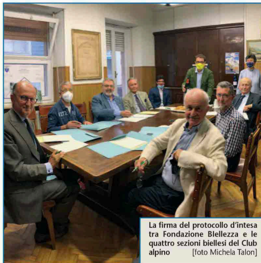
La firma del protocollo d'intesa tra Fondazione Biellezza e le quattro sezioni biellesi del Club alpino

Ad oggi, gli itinerari escursionistici affidati al CAI sono 20, a cui si aggiungono 8 itinerari ciclabili, ma l'intento è quello di arrivare a un totale di 40 itinerari percorribili a piedi e di 20 percorsi ciclabili entro la fine del