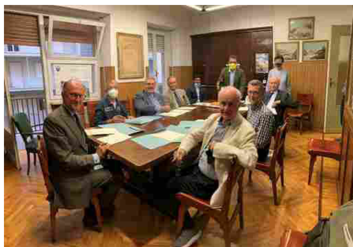
Fondazione Bellezza e CAI uniti per la valorizzazione turistica del Biellese

Alla base del protocollo d'intesa la manutenzione di itinerari escursionistici e cicloturistici.