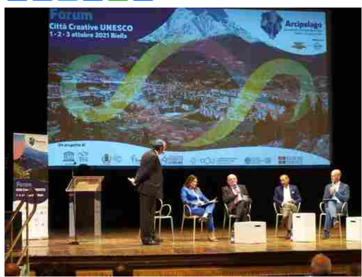
Al Sociale un incontro su montagna, rigenerazione urbana e territoriale