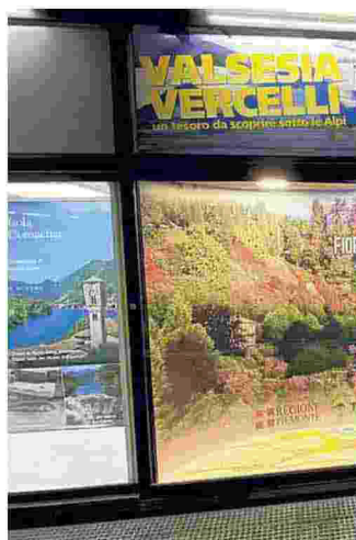
I pannelli in metropolitana

Dal Sacro Monte di Varallo alla fioritura dei rododendri al parco della Burcina, dalle terre del vino di Gattinara al foliage delle montagne in autunno. Vercellese e Biellese si mettono letteralmente in vetrina, e lo fanno in un luogo cruciale per il passaggio di turisti nazionali e internazionali: piazza Duomo a Milano. Alcuni pannelli pubblicitari che riportano le eccellenze dei due territori piemontesi sono stati sistemati all'uscita della metropolitana, a pochi metri dalla Madonnina e in un luogo strategico del turismo Made in Italy: un sito,